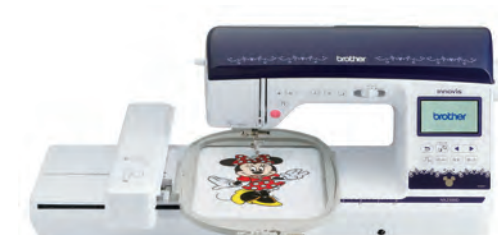
イノヴィス 2500D